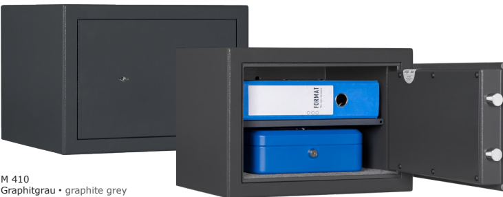
M 410 Graphitgrau • graphite grey