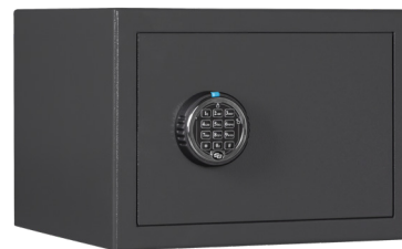
M 410 Elo Graphitgrau • graphite grey

Dekoration nicht im Lieferumfang enthalten • decoration not included in the delivery