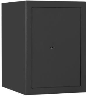
M 210 Graphitgrau • graphite grey