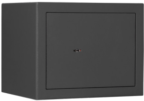
M 310 Graphitgrau • graphite grey